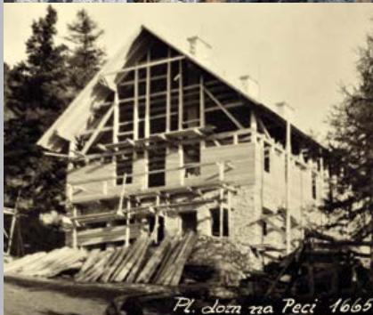
Pl. dom na Peci 1665