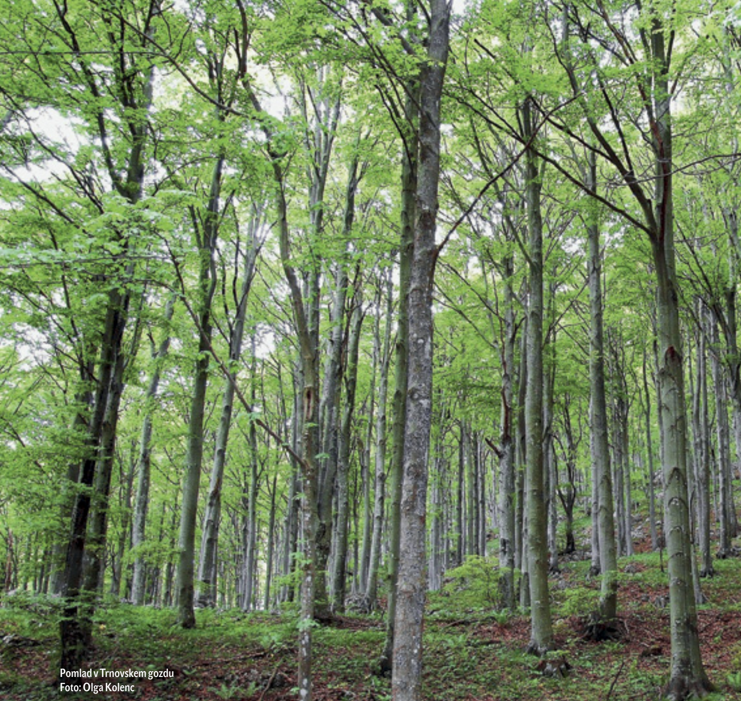
Pomlad v Trnovskem gozdu