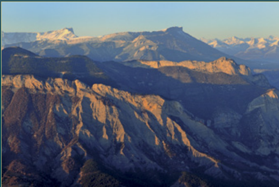
Provansalske Alpe (Francija)

V zadnjih 150 letih smo izgubili več kot polovico ledenikov.