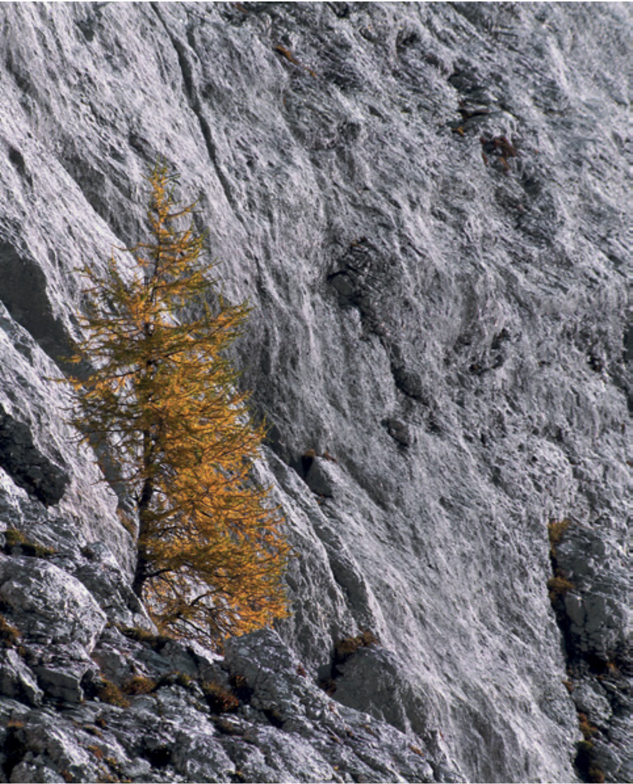
Na mrtvi straži