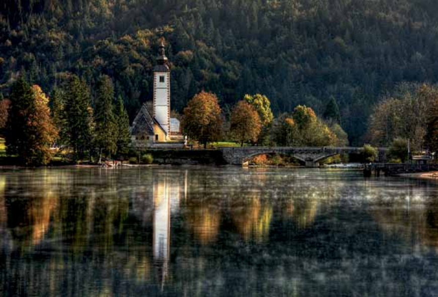
Cerkev sv. Janeza Krstnika ob Bohinjskem jezeru