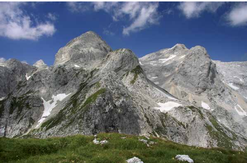
Mišeljski Konec in Kanjavec z Mišeljskega grebena

Sestop: Če imamo vozilo na planini Blato in se želimo držati markacij, drugače kot po isti poti – z izjemo kratkega vršnega dela, ki nas na romarsko pot dostavi zahodno od Hribaric – ne bo šlo, sicer pa je možnosti sestopa s Kanjavca v Bohinj veliko.