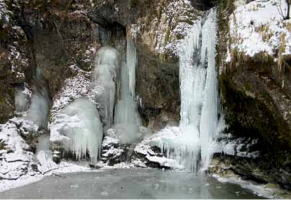
Slap Grmečica v zimskem okrasju

reki. Do slapu ni več daleč. To naznanja sotočje Bohinjke in Grmečice.