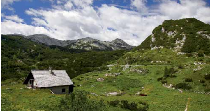
Pogled na Mahavšček in Bogatin s planine Na Kraju

Vzpon: Od Koče pri Savici mimo bližnjega gostišča stopimo na udobno izletniško pot, ki pelje k enemu od najbolj znanih slapov v Sloveniji. Ko se desno odcepi pot k slapu (v poletni sezoni pobirajo vstopnino), zagrizemo v strmino po nadvse udobni široki mulatjeri. Povezava je bila zgrajena med prvo svetovno vojno zaradi potreb avstrijske vojske. Čas nam krajšajo številni oštevilčeni okljuki in kratki pogledi na Bohinjsko jezero, ki je vedno globlje pod nami. Po skoraj petdesetih serpentinah se pot v Peklu kratko poravnava, kmalu pa spet zagrizemo v strmino in mimo vhoda v jamo pridemo do odcepa k Črnemu jezeru. Nadaljujemo po zgornji poti do naslednjega križišča (desno odcep v Dolino Triglavskih jezer) že čisto blizu Doma na Komni. Od njega nas loči le še kratek strm vzpon.