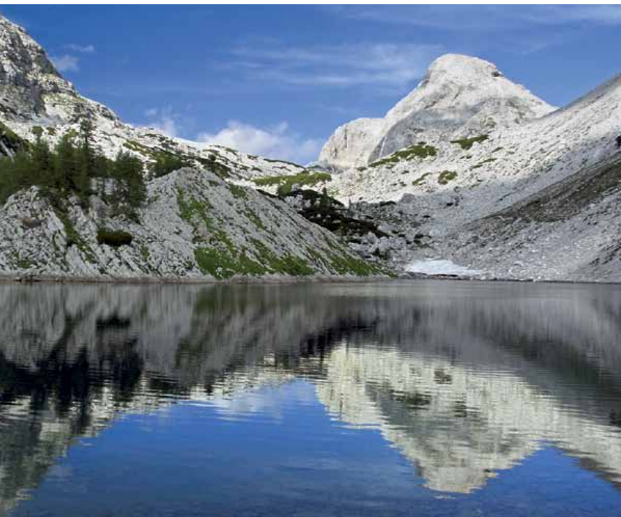
Kanjavec z gladino Velikega jezera (Ledvičke)

Sestop: Če imamo vozilo na planini Blato in se želimo držati markacij, drugače kot po isti poti – z izjemo kratkega vršnega dela, ki nas na romarsko pot dostavi zahodno od Hribaric – ne bo šlo, sicer pa je možnosti sestopa s Kanjavca v Bohinj veliko.