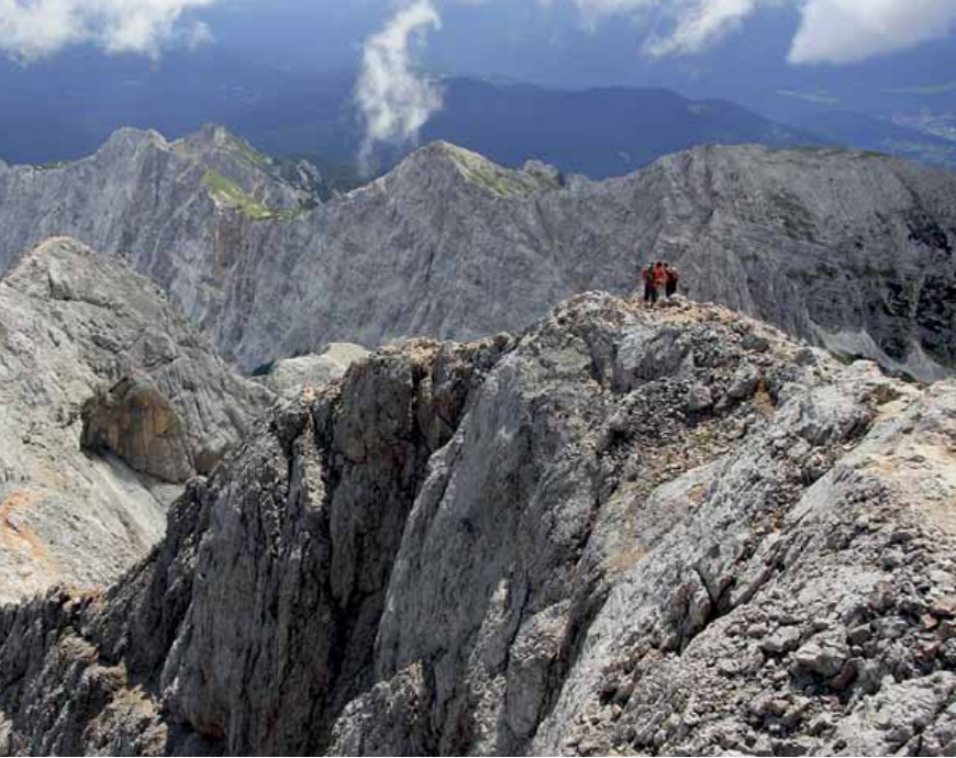
Proti vrhu Triglava. Zadaj zid nad Krmo (Mali in Veliki Draški vrh ter Tosc).

namenjeni, razmeroma lahka. Tudi številne spominske plošče naj nas ne strašijo preveč. Pod vrhom nas čaka še nekaj strmih odsekov. Ko hodeč mimo Staničevega zavetišča zagledamo Aljažev stolp, si resnično lahko oddahnemo.