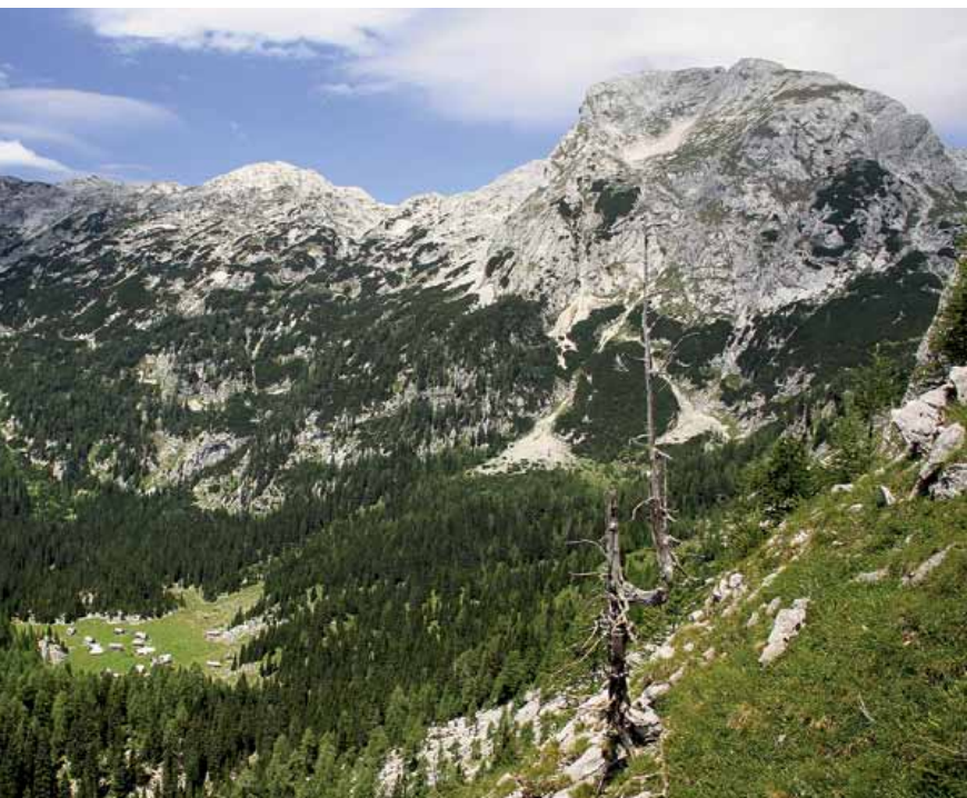
Planina V Lazu z Debelim vrhom na desni

Z Laza sledimo poti proti Planini pri Jezeru, 1450 m, v dno koritaste doline Poljane. Iz nje zavijemo desno in se čez precej strmo pobočje povzpemo na gozdat hrbet, ki se spušča s Krede. Na neizrazitem sedlu se pot prevesi proti planini Dedno polje, 1560 m. Na križpotju stopimo na pot, ki vodi proti Planini pri Jezeru. Kolovoz je sprva zložen, pred Jezerom pa postane strm in je tak do prvih stanov. Po širokem kamnitem kolovozu se vrnemo na Blato.