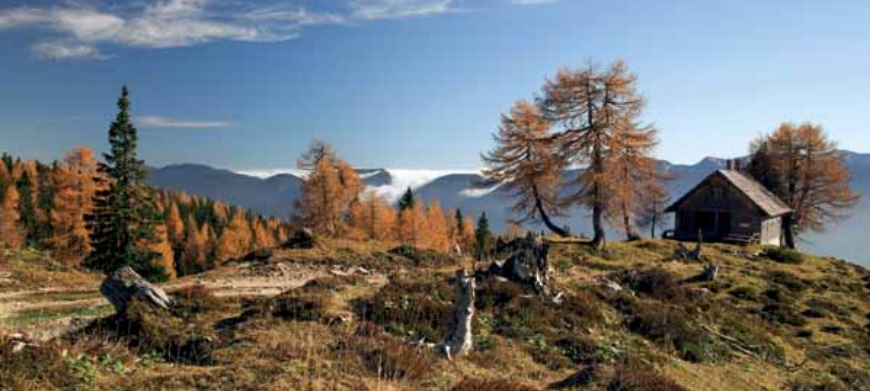
Jesen na planini Krstenica

lovske kočice (v bližini razgledišča). Za lovsko kočico kmalu stopimo iz gozda, se priključimo kolovozu in že smo na travnikih Krstenice.