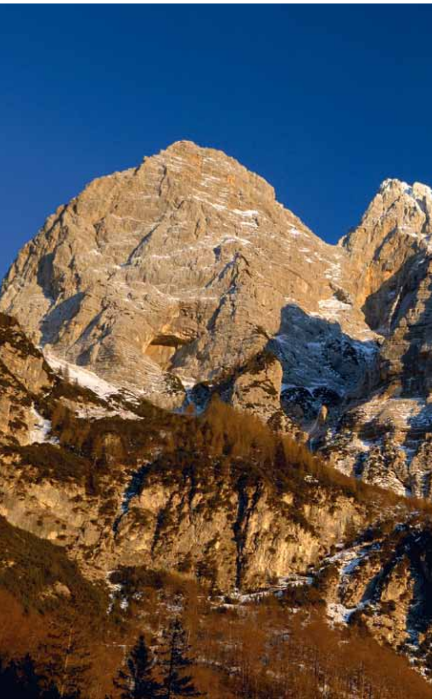
Masiv Pihavca nad Zadnjico, vrh je poprhan s snegom.