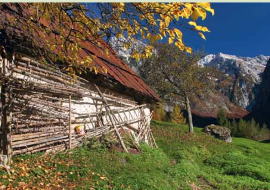
Trentarski hlev, v ozadju Triglav