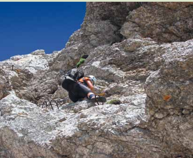
Ferata na Bavški Grintavec je zelo izpostavljena.