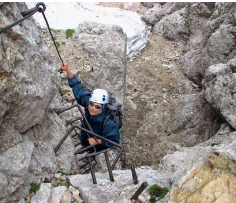
Navpičen prag pod vrhom Pihavca