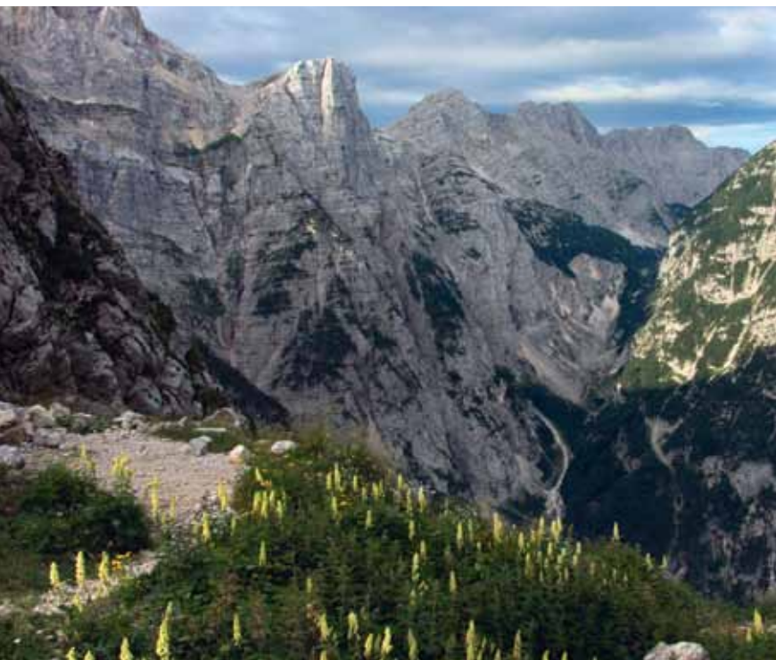
Pogled z Luknje: desno Zadnjiški Ozebnik, levo Vršac, med njima zadaj Vel. Špičje.