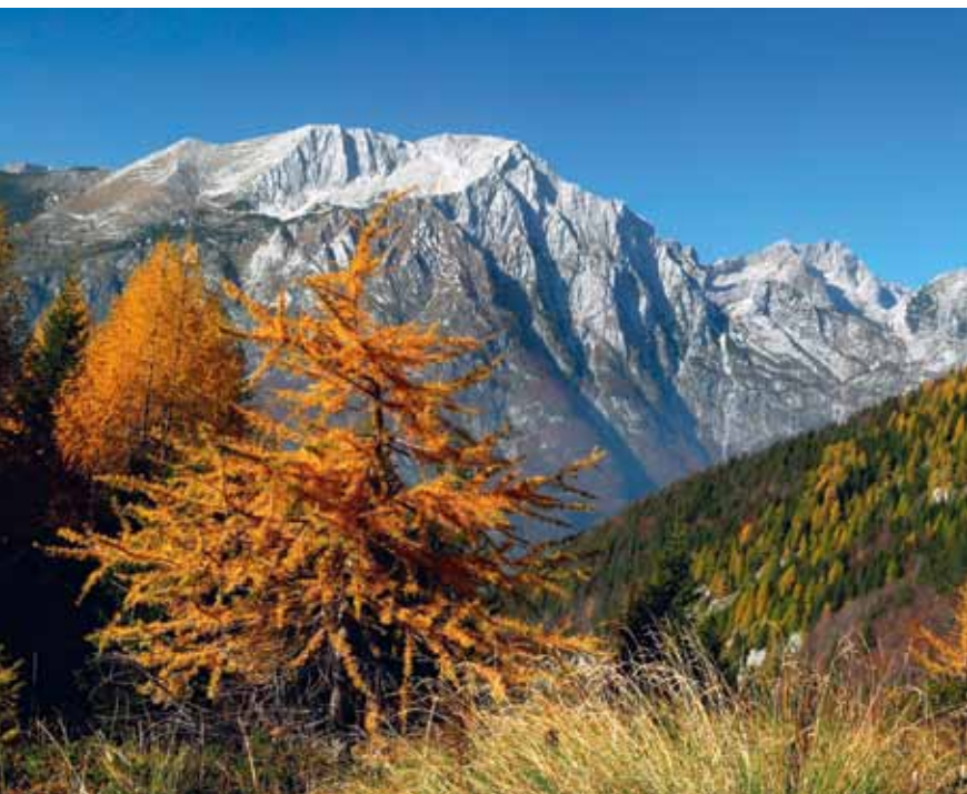
Neskončno visoka južna pobočja Bavškega Grintavca

B avški Grintavec je značilna trentarska gora z izjemno strmimi in visokimi pobočji, ki se dvigajo proti vrhu iz Bavšice, Trente in Zadnje Trente. Vršna glava je skalnata, z nje se spuščajo trije grebeni: severni strmo prepada do Kanskega prevala, 2030 m, kjer se preko nekaj vmesnih vrhov pripenja na greben Pelcev, severovzhodni se prek Velikih vrat, 1794 m, nadaljuje z grebenom Zapotoškega vrha, 1941 m, Srebrnjaka, 2100 m, in Trentskega Pelca, 2109 m, jugozahodni pa se čez številne manj znane vzpetine konča z ošiljenim Svinjakom, 1637 m, nad Bovško kotlino. Zaradi osamljene lege je Bavški Grintavec odličen razglednik, saj nima blizu nobenega pravega tekmeca, ki bi mu jemal veljavo. Na vrh peljejo celo tri označene poti, iz Zadnje Trente, Bavšice in Soče. Zaradi velike relativne višine pobočij je njihova prva značilnost izredna dolžina, poti iz Bavšice in Zadnje Trente sta tudi tehnično zelo zahtevni, pot iz Soče, sicer brez izrazitejših težav, pa je verjetno ena najnapornejših označenih poti sploh v naših gorah. Premagati