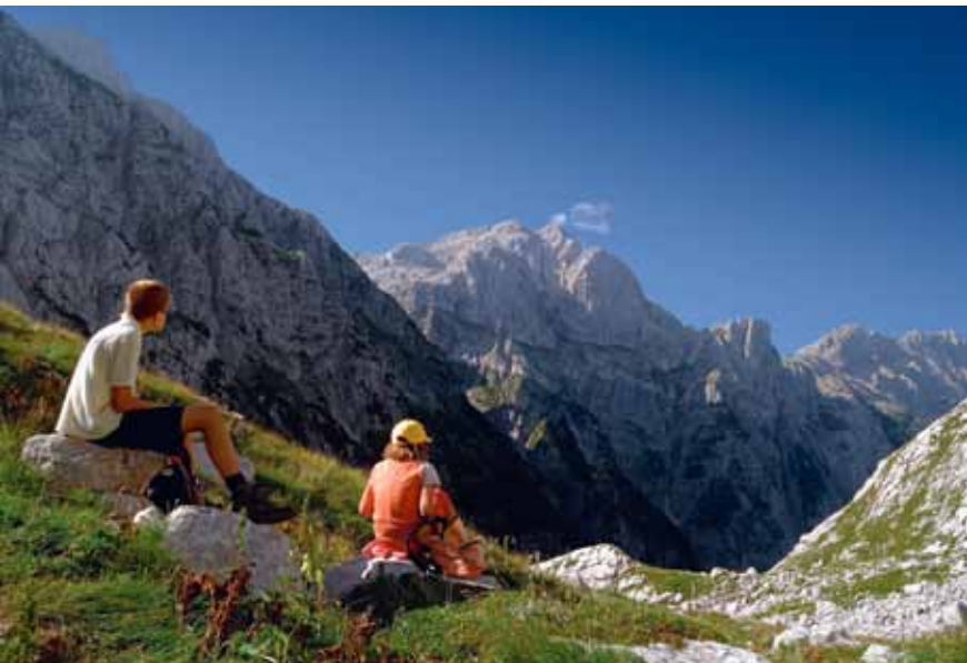
Kanjavec z Luknje

travnatem pobočju. Kmalu uzremo na skali skromen napis »Komar«, ki pokaže v desno. Sledimo stezici, ki prekorači potoček, nato pa se začne kar strmo dvigati proti kapelici v steni; do nje pridemo ob jeklenici, po stopnicah in skobah. Tu se začne resnejši del vzpona: ob jeklenicah plezamo desno po zelo strmem skalovju, po izpostavljenih policah navzgor do grape z značilnim zagozdenim balvanom. Skozi grapo se povzpnejo po klinih mimo balvana, malo naprej pa jo zapustimo v desno po ozki polici, zavarovani z jeklenico. Sledi strmo plezanje navzgor, nato pa levo po zelo izpostavljeni polici nazaj v grapo. Po njej ob varovalih še malo navzgor, nato pa jo zapustimo v levo po slikoviti, izpostavljeni polici, ki nas pripelje v manj strm svet, kjer se težave umirijo. Pot nekaj časa vijuga skozi ruševje in grmovje, višje pa preide na travnato skalnato pobočje tik pod stenami Kanjavca. Tu zavije v levo in se po skrotastem, delno zagruščenem pobočju priključi mulatjeri, ki smo jo zapustili v Zadnjici. Po njej se še slabo uro dvigamo do Koče na Doliču, 2151 m. Od kočice gremo za označbami proti zahodu, pot se strmo dviga po skalnatem svetu skozi neizravno dolinico. Višje zavije rahlo levo, svet je čedalje bolj razbit in zagruščen. Prečkamo manjše melišče, čez skalno zaporo splezamo s pomočjo jeklenice, kmalu zatem pa dosežemo prostorni in razgledni zahodni vrh Kanjavca, kjer je skrinjica z vpisno knjigo.