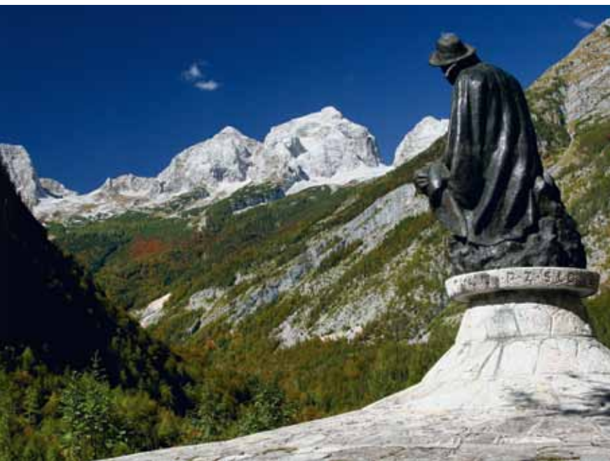
Kugyjev spomenik v Trenti

Od Kugyjevega spomenika gremo navzdol do table proti soteski Mlinarice , ki priteče izpod Razorja. Po visečem mostu čez Sočo pridemo do razgledne ploščadi, s katere lahko le od daleč vidimo kilometer dolgo, divjo sotesko, ki se na koncu močno zoži, voda pa pada čez 8 metrov visok slap. Pri Mlinarici občutimo prvobitno moč in privlačnost gorskega okolja Trente. Po ogledu soteske se vrnemo na cesto in malo niže dospemo do znamenitega Alpskega botaničnega vrta – Alpinum Juliana . Sprehod po bogatem cvetličnem vrtu in posedanje na klopci na slikovitem Belvederu, s krasnim pogledom na dolino, sta nekaj nepozabnega.