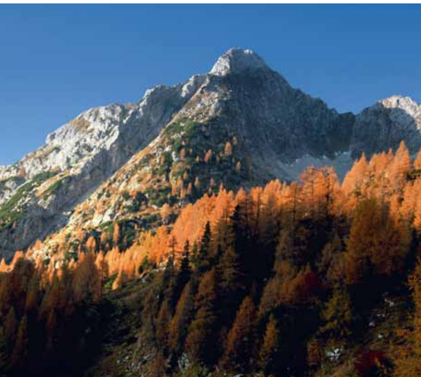
Zagorelec nad Zadnjo Trento

vzpon levo po ozkem grebenu do bližnjega vrha. Z Zagorelca se čez Lužo vrnemo do markirane poti po smeri vzpona.