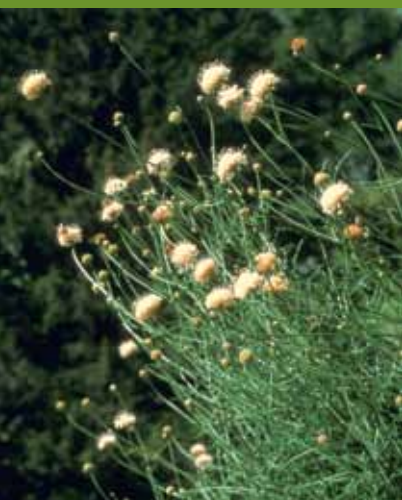
Scabiosa trenta je navadna blede obloglavka ( Cephalaria leucantha), ki v septembru bogato zacveti v alpskem botaničnem vrtu Juliana.