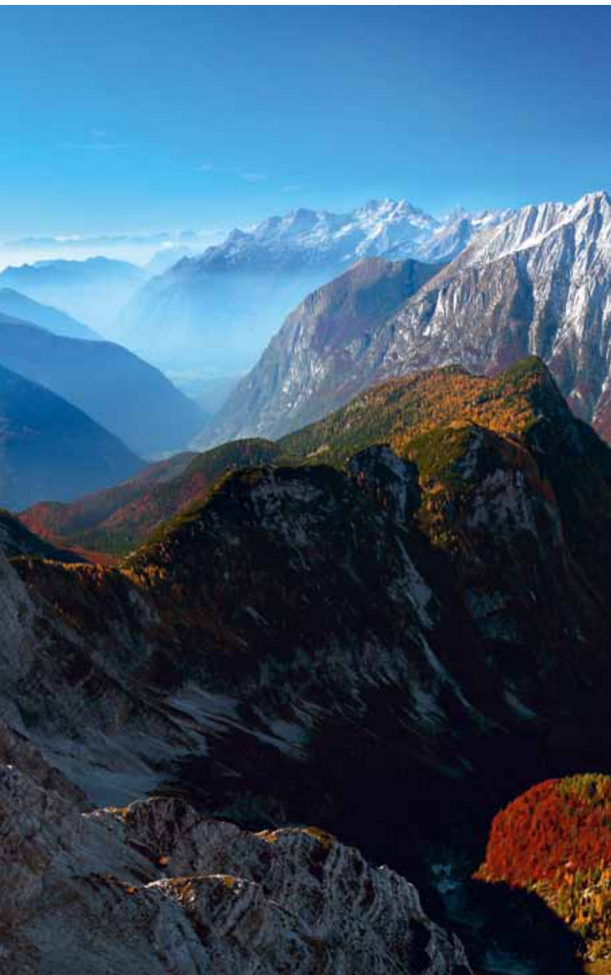
Zlati oktober nad Trento: v sredi Velika Tičarica, za njo desno greben od Bavškega Grintavca do Pelca nad Klonicami