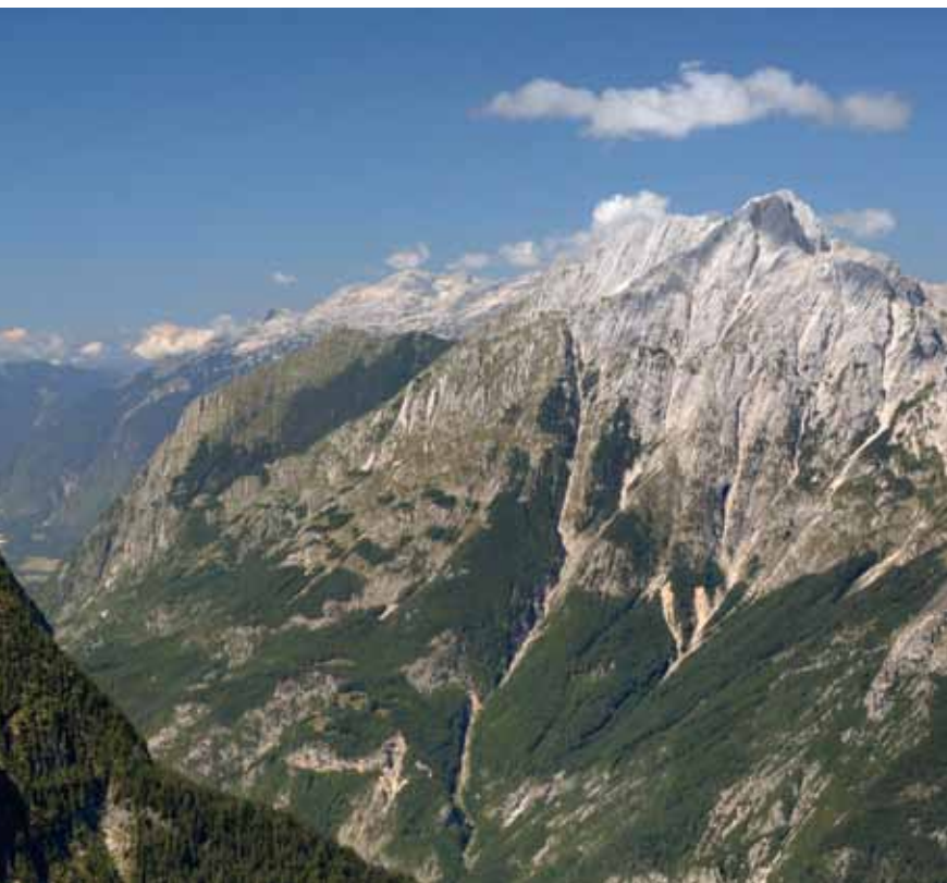
Velika Tičarica in Bavški Grintavec nad Spodnjo Trento

Sestop: Sestopimo po poti vzpona. Lahko pa si privoščimo še majhen ovinek, s katerim popestrimo turo. Priporočimo ga lahko le spretnim stezosledcem, sicer nam neprijetno lomastenje skozi rušje ne uide. Z vrha se vrnemo na škrbino, nato pa med ruševjem iščemo prehode pod Šnito, 1803 m, do golega in zelo razglednega Čistega vrha, 1875 m, ki se dviga nad Trebiškim dolom. Z njega sestopimo po dobri poti do kolovoza, ki nas kmalu pripelje nazaj na planino V Plazeh. Naprej sestopimo po poti vzpona.