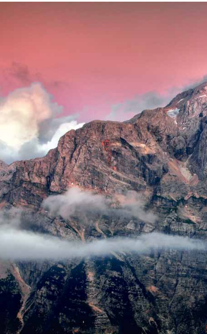
Najvišja stena slovenskih gora; somrak se spušča nad severno steno Kanjavca.