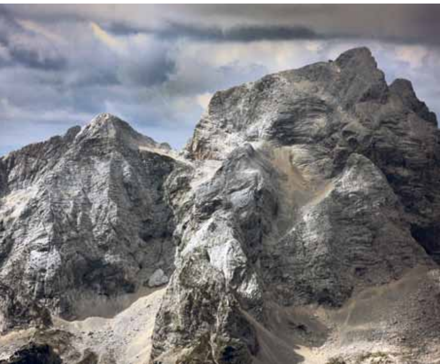
Robata lepota Jalovca nad Trento