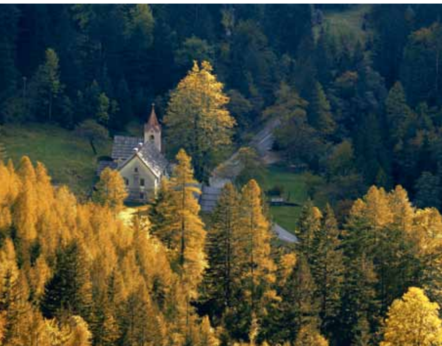
Cerkev sv. Marije Lavretanske v Trenti

Od Juliane se ob cesti napotimo do bližnjega naselja Pri Cerkvi , kjer se nahajajo cerkev sv. Marije Lavretanske (iz Loreta), ostanki trentarskega fužinarstva, slavna Pavrova domačija, malo niže pa še Britof, znamenito trentarsko pokopališče.