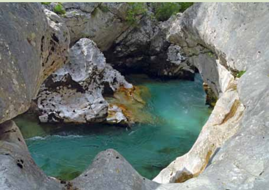
Korita reke Soče