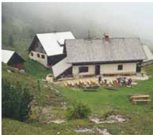
Pred Blejsko kočico

Prepričali smo se, da ima oskrbnik prav, saj je bila hrana res dobra, cene pa tudi primerne drugim podobnim kočam.