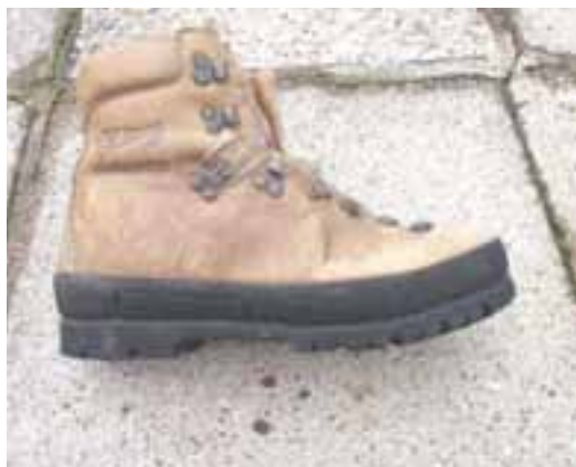
Gumijasti trak na poltogh čevljih, ki so primerni za dereze

obdelanega na čevljarskem kopitu. Izbiramo lahko med spodvito in v banjo gumijastega podplata vloženo lupino. Prednost naj ima spodvita. Njena debelina brez notranje blazinjene plasti naj se giblje med 2,6 in 3,2 mm. Če bomo čevlje rabili vso zimo skoraj vsak konec tedna, je zaželen dobro zlepjen gumijasti trak okoli spodnjega dela, ki na videz povezuje zgornji rob podplata in spodnji del spodvite lupine. Ta bo nekoliko povečal togost čevlja, od katere pa je odvisno, kakšne dereze bomo lahko uporabljali. Na poltoge čevlje gredo poltoge členaste dereze. Te pa so tudi najprimernejše za celodnevne zimske pristope. Z njimi se posredno izognemo predebelemu podplatu ali zelo togi lupini, ki ovirata nekoliko lahkotnejšo hojo, prestopo, sestope in preččenja. Zaradi tega so čevlji še vedno dovolj učinkoviti za mešani svet, kjer se menjavajo skala, sneg, snežni poprh in požled.