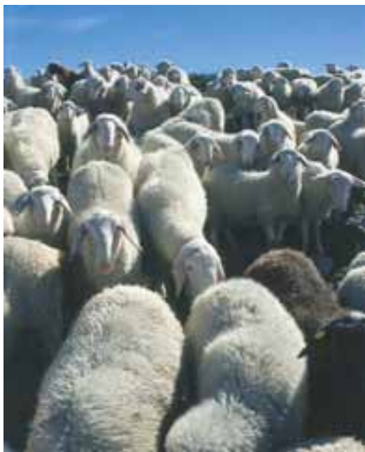
Ko prinesejo sol