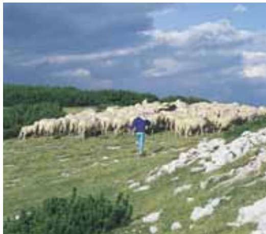
Jih žene v dolino?

»Kam rineš, hudič te vzemi!« je zavpil Tilen na ovco in jo potegnil nazaj. »Samo še malo, da prideva do roba, kjer se pot prevesi,« je dejal in pograbila sta nahrbtnike ter se odpravila. Tistih sto metrov do roba je Roza blejala in vlekla nazaj kot prašič, ko ga vlečejo pred mesarja. Tilen res ni govoril tja v en dan. Ko sta prišla malo čez rob, kjer se pot prevesi navzdol v Bohinj, je zavohala travo iz tople doline ali kdove kaj, oba sta jo morala prijeti, da jo je lahko odvezal, da je potem lahko kar sama tekla naprej. Spodaj je bila topla dolina, čeprav deževna in megljena, toda zima bo do nje rabila vsaj še mesec dni. Spodaj je čreda, naša in njihova, ljudi čaka topla peč, živino domača staja, planino pa počitek pod hladno odejo. Jagenjček v Klemenovem naročju pa je zaspal.