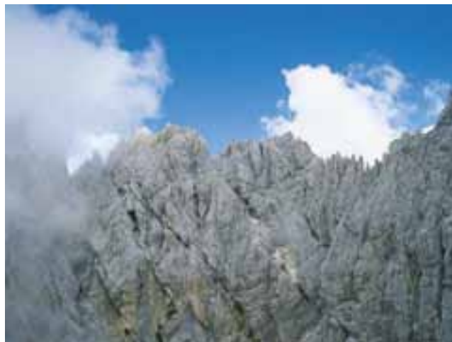
Greben Oltar – Visoki Rokav – Škratica

Niti opazil ni, kdaj je zaspal. Zbudil ga je grom. Ko je odprl oči, na nebu ni bilo več belih oblakov. Od zahoda so se valili črni oblaki in že pogoltnili