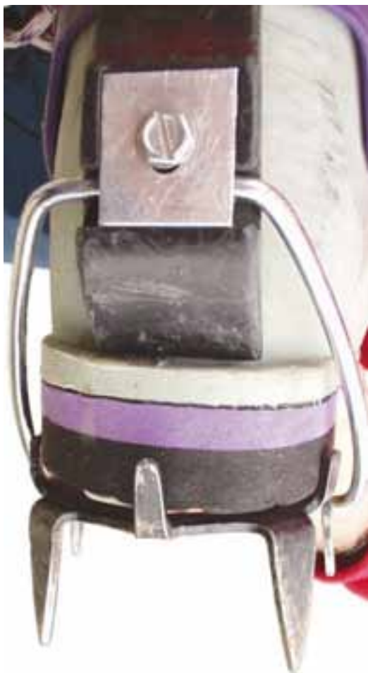
Primeren utor za petno vez avtomatskih derez