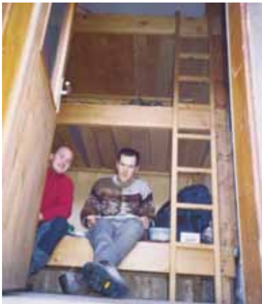
Koča na Planini pri Jezeru leži na območju, ki je pozimi zelo obiskano