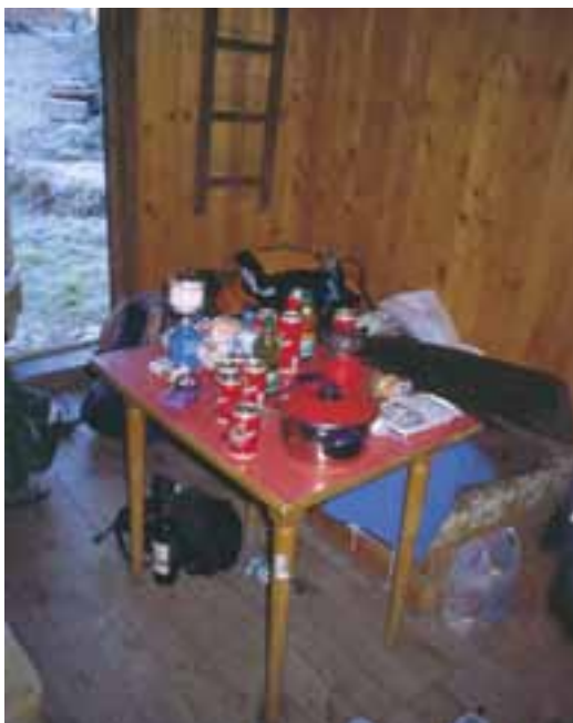
Notranjost zimske sobe

Žal čistoča tukaj še ni pognala korenin. Metla predstavlja del opreme, ki je najmanj obrabljena. Odeje in žimnice že nekaj časa niso občutile bla-