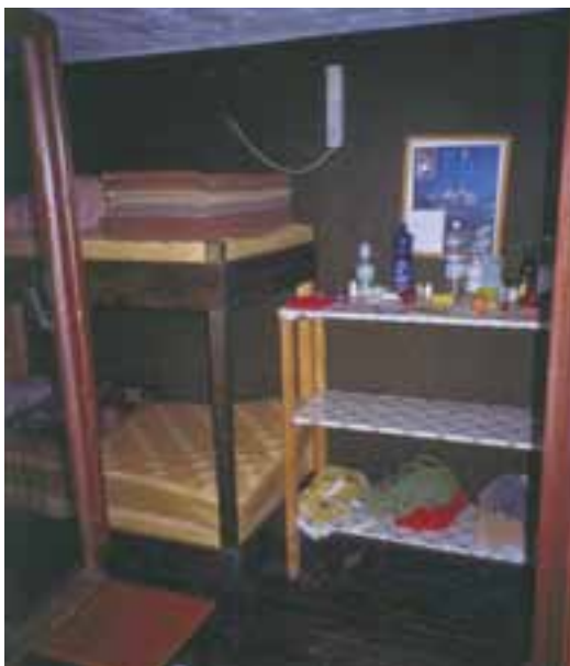
Pozimi je Kranjska kočica in s tem njena zimska soba malo obiskana