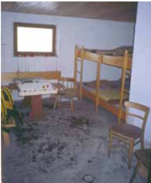
Prostorna zimska soba v Cojzovi koči

kot smetišnico, verjetno pa bo še bolj dobrodošla za odmetavanje snega izpred vhodnih vrat.