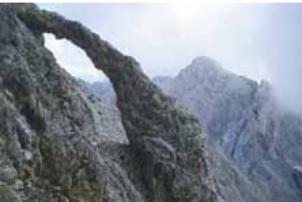
Okno v Oltarju

Bivak je bil prazen. Iz vpisne knjige je izvedel, da je bil nekdo danes še pred njim tukaj in že odšel proti Dovškemu križu in Škrnatarici. Vpisal se je še sam. »No, pa se ne bova srečala, saj gre moja pot levo, njegova pa desno.«