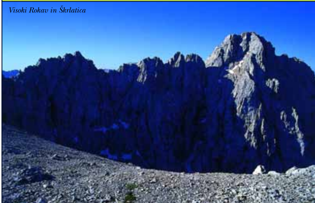
Visoki Rokav in Škrlatica