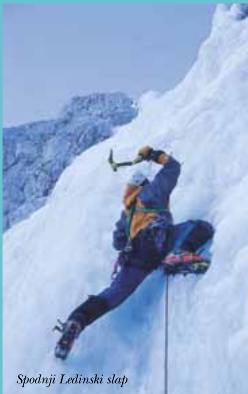
Spodnji Ledinski slap

vemu gore-tex kompletu. In kaj še čakate? Ah, ne veste kam, pojma nimate, kje bi našli led, saj še niste preplezali niti enega samega slapu!? Ja, še eden tistih, ki je nasedel reklamam. Zelenec pač! No, tokrat vam ne bomo kaj prida pomagali pri izbiri ture, le usmerili vas bomo. Če nimate izkušenj iz plezanja v ledu, bo treba v kakšno alpinistično šolo ali pa najeti vodnika. Oboje nekaj stane in ko boste preplezali dovolj metrov (lažjega) ledu po dolinah, kot so na primer Logarska, Tamar, pa Koritnica in še kje, se boste podali tudi v kakšen bolj znamenit (težji) kos ledu. Z izkušnjami je zagotovo lažje in tudi lepše. Lahko si izberete na primer slap LuciFer blizu Gozda – Martuljka, ki je bil januarja 1979 prvi preplezani slap pri nas. Lahko pa se odpravite tudi na Jezersko, kjer je pod Ledinskim vrhom naš tokratni cilj – Ledinski slap.