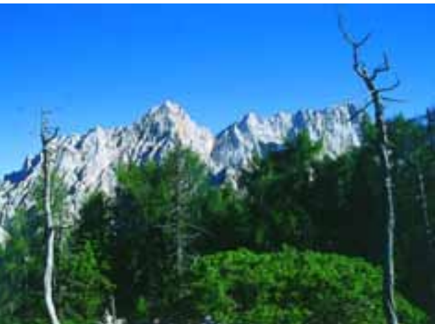
Kukova špica, Škrnatarica in Široka peč

vala do Dovškega križa. Pot gre večinoma skoraj po grebenu, le tu in tam se težavam ogne na južno stran. Težave so zmerne, razgled pa ne. Na Dovškem križu je pogled že iskal tako zelene Rokave, najvišje brezpotje v Julijskih Alpah. V Rokavskem ozebniku je bilo še vse polno snega, v nahrbtniku pa dereze in cepin. Takoj sva bila odločena, da greva pogledat na vrh ozebnika. »Da si ogledava teren za smučanje,« sva takoj našla trdno utemeljitev. Na glas si nisva priznala, da greva od blizu pogledat plezalno smer na najvišji Rokav (III/II, 150 m), mogoče bi tudi samo malo poskusila ... če bo gora želela.