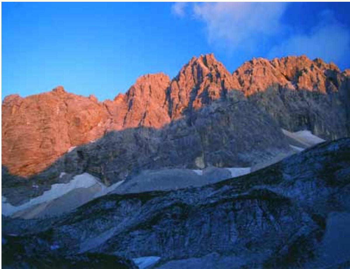
Rokavi v večernem soncu

Noč je spet začela priganjati. S tiho zahvalo v srcu sva se še zadnjič zagledala v steno Visokega Roka in se previdno spustila skozi ozebnik. Spodaj pa v iskrivem naletu, s svežimi vtisi v mislih in srečo v srcu preletela neprekosljivo melišče Julijskih Alp in se ustavila, ko so se za nama zaprla Vrata.