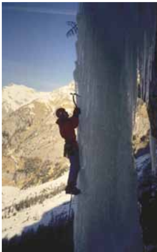
Prve resnejše vertikale: L'ira di Beppe, Val Di Daone, WI 6

Vendar je ledno plezanje tudi več kot le to. Meni pomeni posebno strast, ki se vsako leto znova prebuja. Ta strast ni povezana s plezalskim užitkom, ker ta pri težkih vzponih ni prisoten. V mnogih pogovorih s kolegi soplezalci smo se večkrat strinjali v eni stvari: da počnemo te stvari zato, ker se je tako lepo vračati nazaj