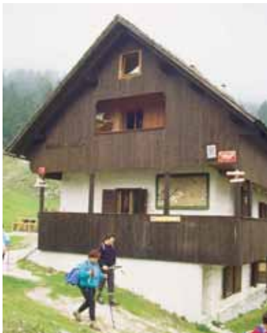
Blejska koč je ena najbolj obiskanih koč pri nas

v tistem dnevu – Brda . Čeprav je nekoliko nižji od prvega, je po razgledu morda še lepši. Posebno bližina Triglava nas je tako očarala, da kar nismo mogli naprej. Z Brd smo se spustili na Lipanska vrata, kamor s severne strani pripelje pot iz Krme. Precej strma je videti, kar nam je že prej potrdil tudi pogled z zadnjega vrha. Spet smo se rahlo povzpeli in že stali na Lipanskem vrhu. Sestop naprej po grebenu proti Mrežcam je nemarkiran in dokaj zahteven, zato ga neveščim obiskovalcem brez usposobljenega vodnika odsvetujem. Najbo-