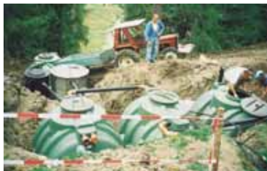
Montaža čistilne naprave