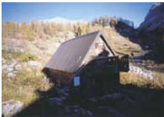
Zimska soba pri Triglavskih jezerih je v samostojni koči

Na zunaj vliva zaupanje v udobje solidna streha, notranjost pa je malce drugačna.