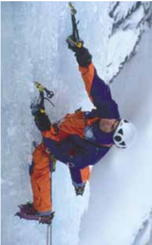
1. ponovitev Lambade, WI 6+, Prisojnik, 1999

ji lahko na vzpon precej vplivajo: višje temperature ga pogosto olajšajo, nižje pa otežijo. Noben vzpon pa se praviloma ne konča, ko dosežemo vrh smeri, pač pa šele, ko se vrnemo na izhodišče, tja, kjer smo s turo začeli. Sestop neredko predstavlja še poseben izziv in zahteva dodatno koncentracijo, saj je včasih kočljivejši in nevarnejši od samega vzpona. Pogosto so se prav na sestopih dogajale nesreče bodisi zaradi utrujenosti bodisi zaradi premajhne pozornosti ali nepredvidenih dogodkov .