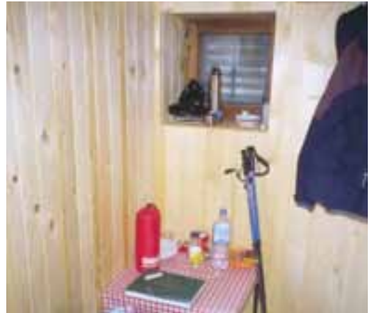
V zimski sobi se je našel prostor tudi za majhno mizico

ke. V primeru, da bi bilo gornikov več, kot se jih lahko stisne v sobi, je v okolici kočee več pastirskih staj (ali bolje rečeno vikendov), kjer se lahko pod streho namesti cela četa ljudi. Toda omenjene staje nudijo le streho in sta tedaj nujno potrebni dobra spalna vreča in izolacijska podloga.