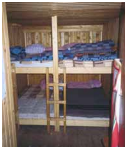
Lepo urejena zimska soba v Češki koči

Splošni vtis je, da je ta zimska soba neke vrste »ljubljenček« nekaterih Jezerjanov. Iz vpisne knjige je namreč razvidno, da je tura z Jezerskega do Spodnjih Raven priljubljen popoldanski trening,