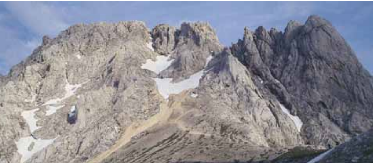
Veliki Oltar (levo), Mali Oltar (desno)

vrh Škrlatic. Strela je spet osvetlila črnino oblakov in grom je trenutek za tem razparal visokogorsko tišino.