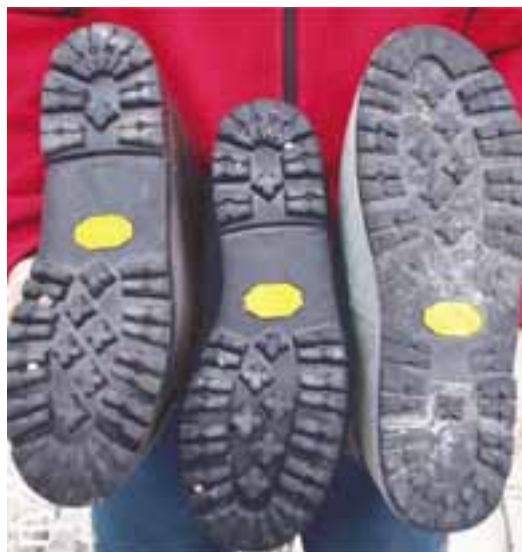
Družina vibram podplatov ostaja še vedno na vrhu

Zanimajo nas njihova velikost, njegova oblika, vrsta gume in vgrajeni dušilci udarcev. Odločimo se za nekoliko širše podplate. Sicer nas bo pri ozkem podplatu v trdnejšem snegu zanašalo, pri plezanju v lažjem požledenem skalnem odstavku pa ne bomo imeli nobenega pravega občutka za stope v skali ali stopinje v snegu. Po obliki imamo na izbiri vibram ali rebraste pod-