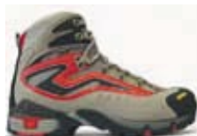
POWER MATIC 400GV